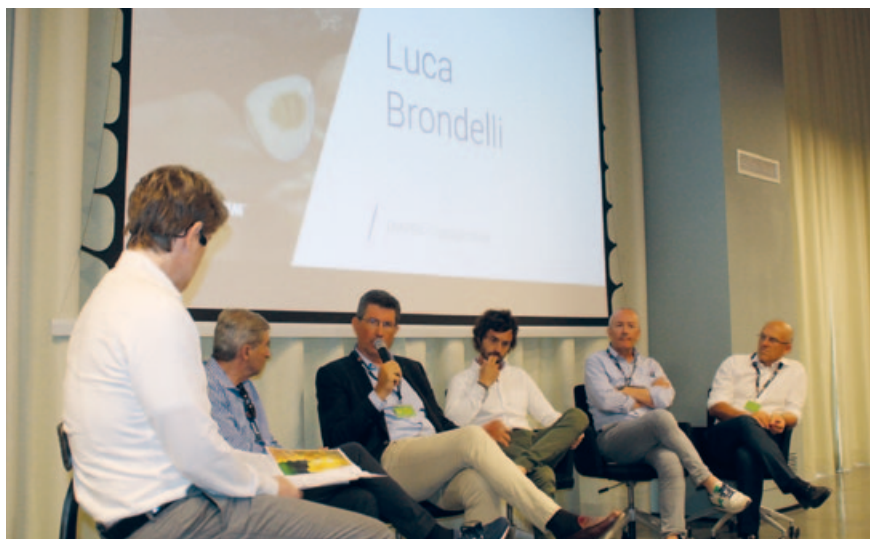
Nel corso della intensa giornata, si sono tenuti incontri tecnici, visita ad impianti e soluzioni tecniche aziendali, ecc.

"Essere lungimiranti è fondamentale, ma da soli non si va da nessuna parte - ha concluso il presidente di Confagricoltura -. L'impresa agricola ha bisogno di uno Stato partner, di ricerca finalizzata, di agroindustria che faccia sistema. Deve poter disporre di adeguate infrastrutture (energetiche, stradali, digitali, banda ultralarga, ferroviarie, ecc.) e di tecnologie (block chain) che sono determinanti per la competitività".