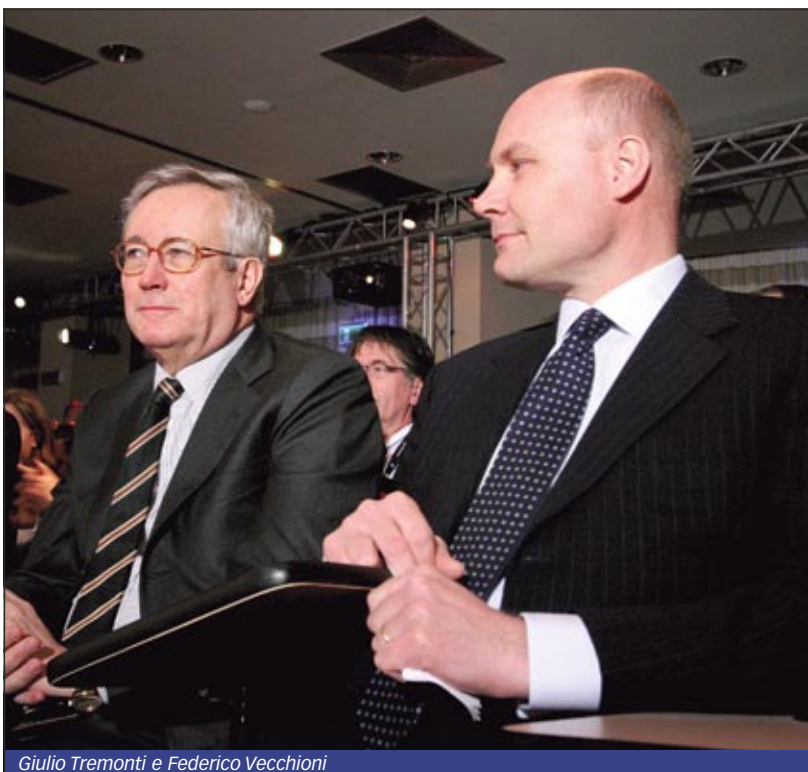
Giulio Tremonti e Federico Vecchioni

Per questo c'è bisogno di un rilancio delle produzioni, di regole comuni e di strumenti per gestire il mercato, che non possono andare né nella direzione del protezionismo, né in quella di una liberalizzazione sfrenata degli scambi, che causerebbe squilibri devastanti, soprattutto a scapito dei Paesi in via di sviluppo. La necessità di nuove regole è dettata anche da quanto successo di recente: sembra ormai passata la crisi delle materie prime alimentari che ha alimentato tra il 2007 ed il 2008 una spirale di prezzi al rialzo; le quotazioni sono scese e per gli operatori del settore è rimasta la chiara sensazione che la stabilità dei mercati sia solo un ricordo. Basta una serie di eventi collegati l'un l'altro per ridurre le produzioni ed alzare i prezzi; o, viceversa, per aumentare gli stock e innescare un'ondata ribassista. Inutile dire che a risentire di questa instabilità sono innanzitutto i redditi degli agricoltori.