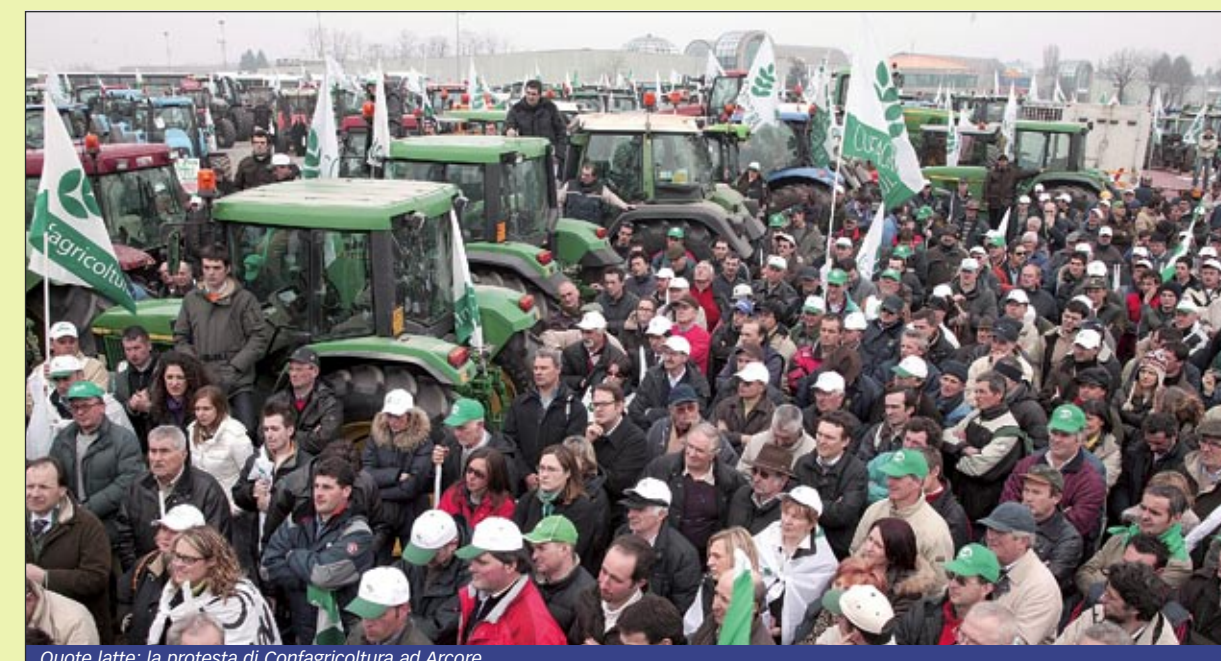
Quote latte: la protesta di Confagricoltura ad Arcore

Con il Consiglio dei ministri europeo dello scorso novembre veniva assegnato un aumento di plafond all'Italia del 5% pari a circa 500.000 tonnellate di latte, risolvendo con anticipo una delle più grosse ingiustizie generate a livello europeo. Il ministro emanava nei primi giorni di gennaio un decreto che riservava ai soli "splaforatori" questo incremento di quota nazionale, dimenticando di fatto tutti coloro che nel