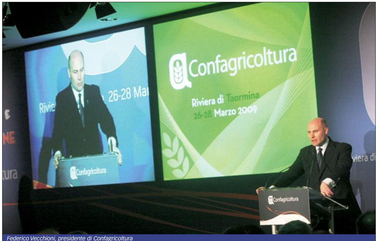
Federico Vecchioni, presidente di Confagricoltura

Numerosi anche in questa edizione gli ospiti intervenuti all'appuntamento: tra questi, il ministro del Lavoro e delle Politiche sociali Maurizio Sacconi, il sottosegretario allo Sviluppo economico Adolfo Urso, il presidente dell'Udc Pierferdinando Casini, il vicepresidente della Commissione agricoltura del Senato Paolo de Castro. Ospite speciale il premio Nobel Rita Levi Montalcini, che ha portato un messaggio rassicurante sull'impiego degli Ogm: "Averne paura - ha detto - è superstizione". Particolare interesse ha suscitato la relazione del-