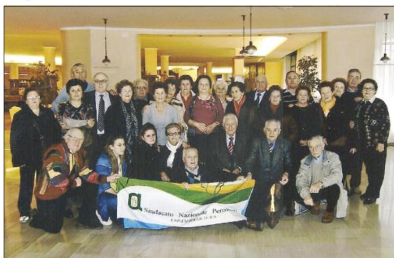
Il gruppo rodigino nella hall dell'hotel Commodore

Per i nostri associati interessati a trascorrere un periodo alle terme nel corso dell'anno, il Sindacato pensionati di Confagricoltura ha stipulato una convenzione molto conveniente con l'hotel Commodore: 60 euro a persona in camera doppia con pensione completa, accesso illimitato alle quattro piscine termali con idromassaggi, accappatoio e telo bagno in dotazione, accesso e utilizzo della palestra, della sauna finlandese e della grotta termale. Riduzione del 10% per massaggi e trattamenti benessere. Cure termali con impegnativa del medico curante, con il costo del ticket.