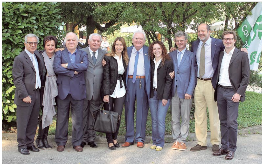
FOTO DI GRUPPO CON ALCUNI RELATORI E ORGANIZZATORI DELL'INCONTRO