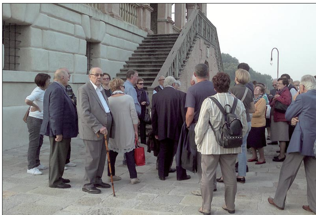
TORREGLIA. I RODIGINI ENTRANO NELLA VILLA DEI VESCOVI AL TERMINE DEL CONVEGNO