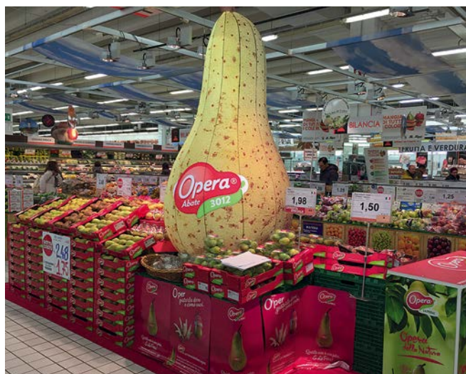
Lo spazio espositivo Opera all' Aliper di Rovigo in contemporanea alla campagna pubblicitaria TV e stampa

Chi non ha la forza, la capacità in proprio di investire, deve cercare alleati, compagni di strada sia nel settore, sia andando a bussare alla porta della Gdo che si dice sempre pronta a partecipare a progetti di valorizzazione del made in Italy. Qualche volta millanta, qualche volta lo fa davvero. Certo che un mondo produttivo meno litigioso e più organizzato (e quindi più in grado di programmare) potrebbe condizionare di più la Gdo e sperare, se non di trattare alla pari, almeno di vivere senza il coltello alla gola. Comunque è il momento del food. Orsero ha trovato un partner finanziario in Glenalta e, forte di un ritrovato equilibrio economico, si appresta a sbarcare in Borsa, primo gruppo dell'ortofrutta a fare il grande passo. Altri fanno alleanze strategiche come Noberasco e Besana nella frutta secca. I grandi melai del Trentino Alto Adige si sono uniti in From, per esportare meglio su mercati come India e Russia. In Romagna