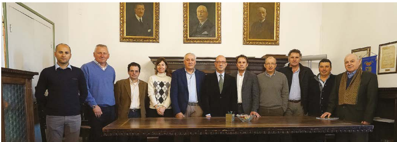
La nuova giunta esecutiva della nostra associazione

vi sono opportunità che permettono di guardare al futuro in modo costruttivo, nonostante le difficoltà, cercando di cogliere le opportunità anche facendo squadra fra associazioni di categoria e istituzioni. Quale amministratore di consorzio di bonifica ha evidenziato che questo è il metodo che ha permesso ad esempio di ripristinare le risorse per gli interventi contro la subsidenza, grazie all'iniziativa partita da Rovigo.