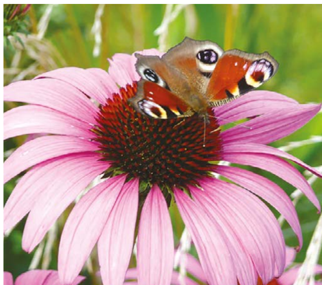
Echinacea coltivata dalla 4D del Munerati