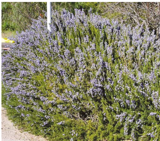
Un cespuoglio di rosmarino coltivato dalla 5C del Munerati