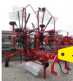
LELY HIBISCUS 745CD