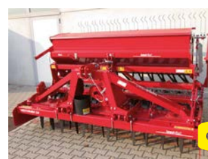
BREVIGLIERI COMBI 300