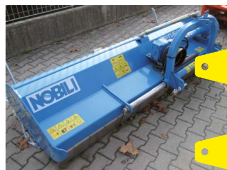
NOBILI VKD 190