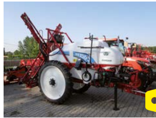
BARGAM IRIS 2200 - Bara 15mt a X