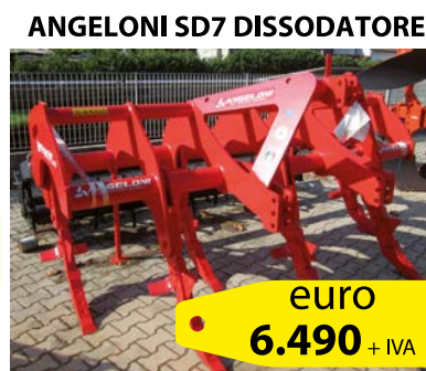
ANGELONI SD7 DISSODATORE