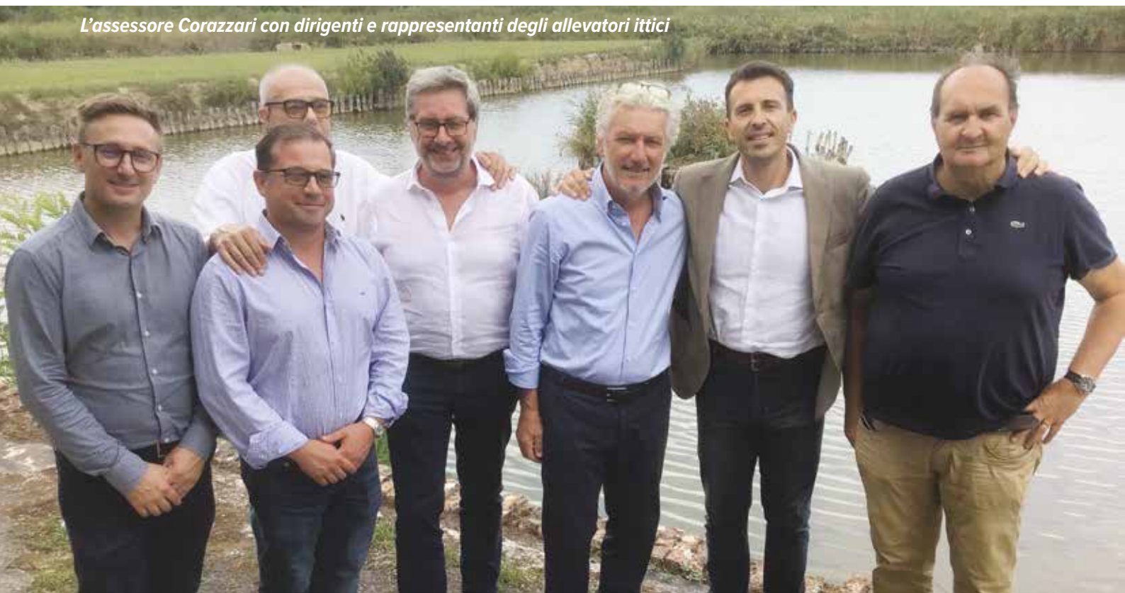
L'assessore Corazzari con dirigenti e rappresentanti degli allevatori ittici

ra della specie alloctona. Adesso, grazie alla prevenzione, i quantitativi catturati stanno calando e la stagione fredda dovrebbe rallentare la presenza, in quanto l'acqua in laguna può anche gelare e perciò i granchi nuotatori usciranno probabilmente in mare. Bisogna trovare un modo perché poi non ritornino in massa. Un sistema potrebbe essere quello