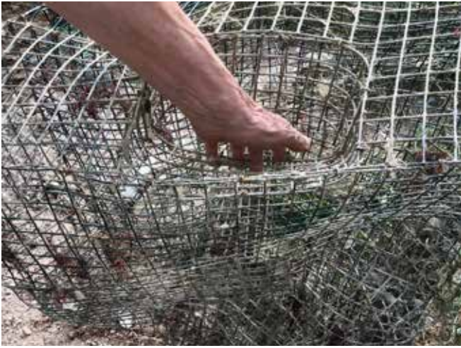
Una rete per la cattura dei granchi