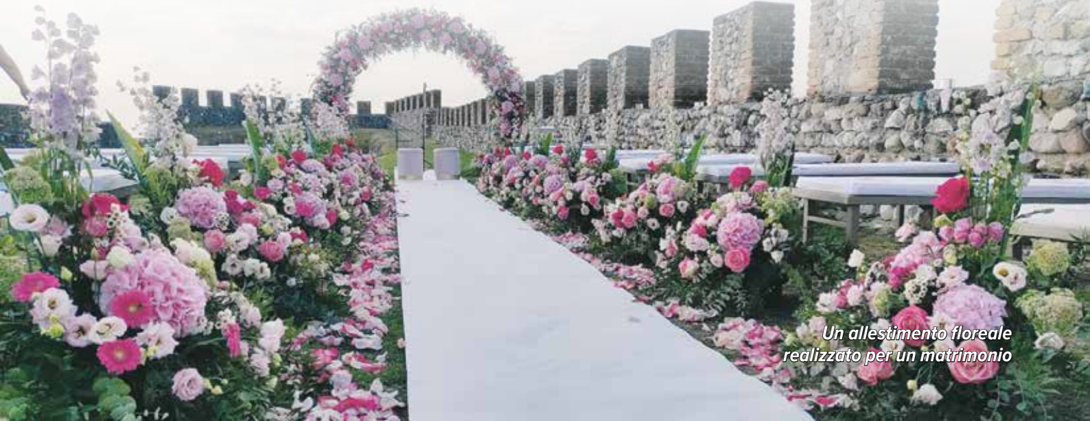
Un allestimento floreale realizzato per un matrimonio