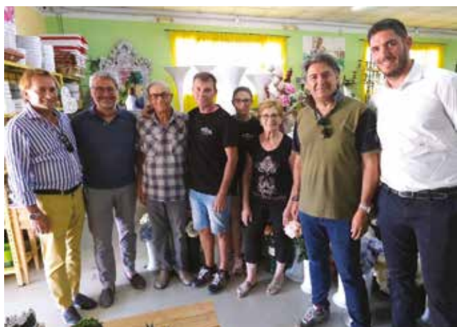
Lo staff dell'azienda con il presidente, il direttore e i tecnici dell'ufficio di zona di Lendinara