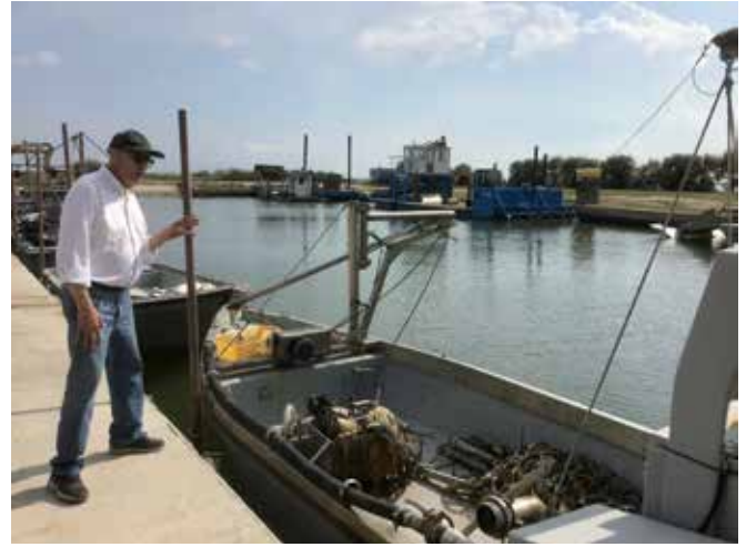
Una barca dei pescatori in laguna

di utilizzare la pesca a strascico, limitata ai periodi in cui si riproducono, in quei chilometri di costa dove attualmente è vietata. Servirebbe una deroga da parte dello Stato, ma dev'essere un'operazione rapida. Il tempo è il nostro primo nemico: dobbiamo intercettare i movimenti del granchio velocemente e anticipare le sue mosse, altrimenti subiremo una nuova invasione”.