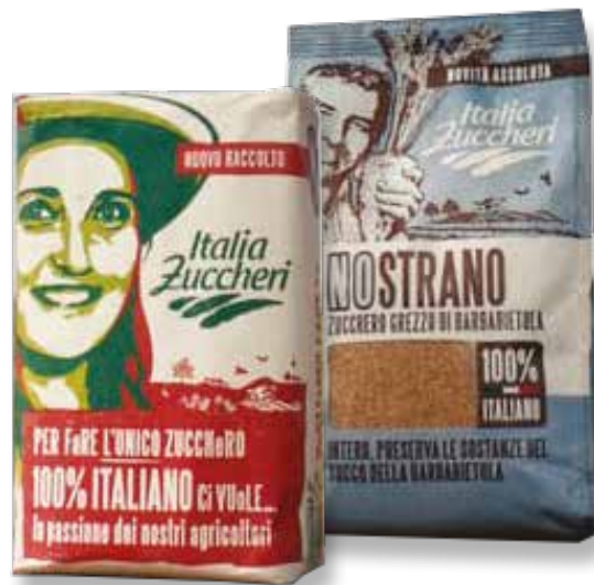
Lo zucchero prodotto a Pontelongo

Era partito bene il 2024 per le barbabietole da zucchero, segnando una ripresa dopo anni di difficoltà segnati dal calo delle superfici e dei prezzi. I numeri dicevano che in Veneto gli ettari investiti nella coltura erano oltre 8.500, in netto aumento rispetto ai 6.600 ettari del 2023. Un ottimo risultato, considerando che non tutti i produttori erano riusciti a seminare in tempo tra febbraio e marzo, a causa del maltempo.