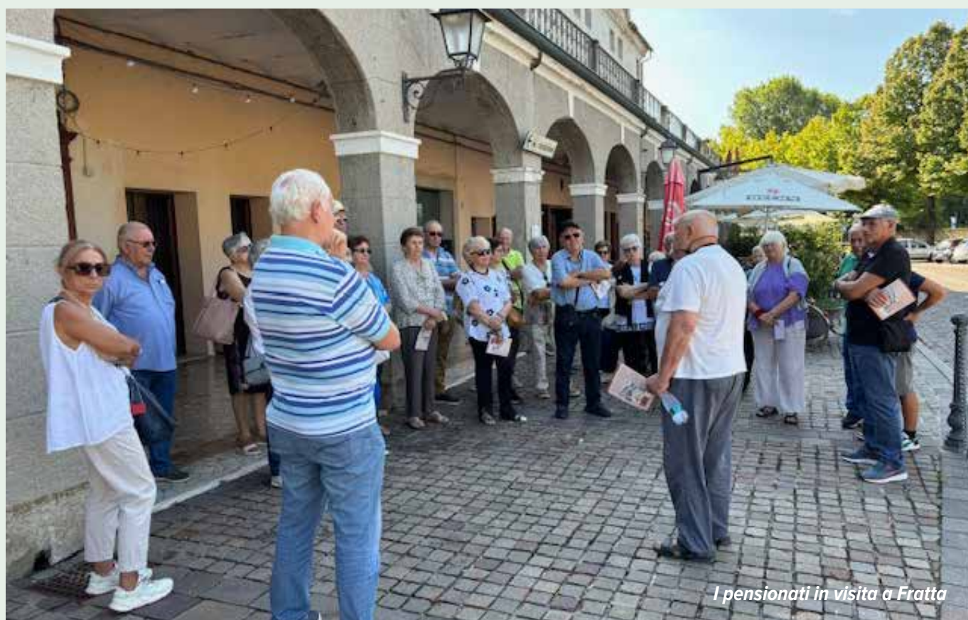
I pensionati in visita a Fratta