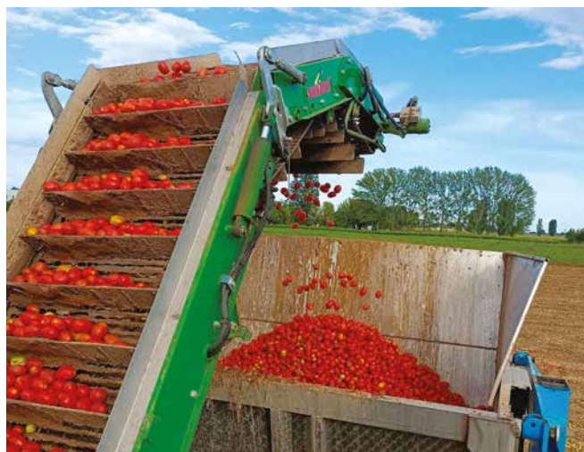
La raccolta dei pomodori da industria