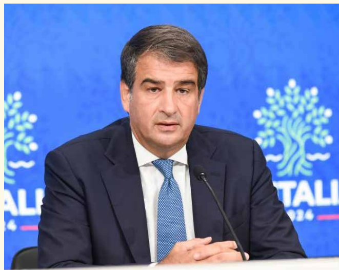
Raffaele Fitto, ministro degli affari europei

Si legge di mancanza di ratifiche da parte della Slovenia , di non sufficienti indicazioni di nominativi femminili, di pruriti da parte dei socialisti nell’acceptare il commissario Raffaele Fitto , espressione di un partito di destra. In ogni caso la macchina europea sta aspettando di conoscere chi guiderà per i prossimi cinque anni le diverse Commissioni (i nostri ministeri). Indubbiamente dal Commissario designato dipende gran parte delle scelte che verranno poi tramutate in regolamenti comunitari per la politica specifica futura.