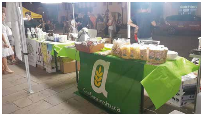
L'esposizione di prodotti a km 0 in piazza a Rovigo

Successivamente Anga Rovigo ha preso parte al Super G , evento che ha visto la partecipazione di numerose associazioni di settore tra cui i Giovani consulenti del lavoro, Avvocati e Commercialisti. L'i-