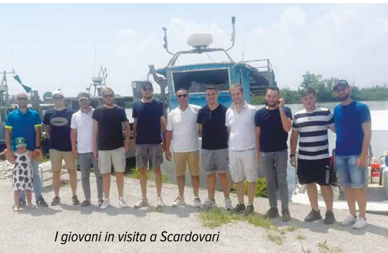
I giovani in visita a Scardovari